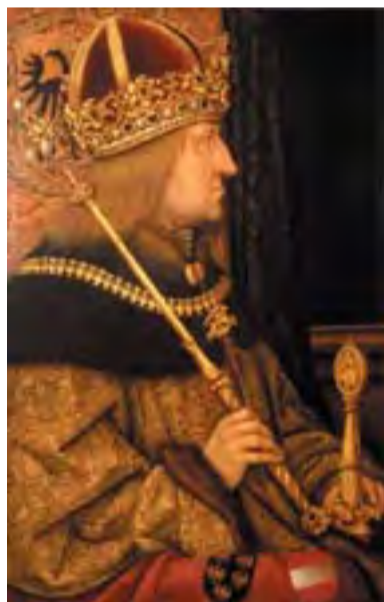
V. László király egykorú portréja

Az ország egyik legbefolyásosabb nagybirtokos családjának életében a családfő, a nándorfehérvári győztes, Hunyadi János 1456 augusztus 11-én bekövetkezett halála komoly változást hozott. Hunyadi János halála után a Habsburg család sarja, V. László király közeli hívét és rokonát, Cillei Ulrikot nevezte ki országos főkapitánynak. Cillei azonban elődjével szemben a hatalmát nem a fenyegető török veszély megfékezésére, hanem a Hunyadi család — az ország leggazdagabb birtokos famíliája — megsarcolására igyekezett felhasználni.