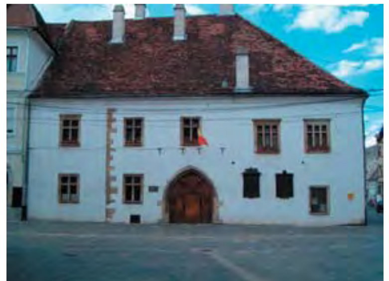
Mátyás király szülőháza Kolozsváron

V. László 1457 november 23-án váratlanul elhunyt. Rebesgetik, hogy megmérgezték, de erre nincs történelmi bizonyosság. Mindenesre a király hirtelen halálával megüresedett a magyar trón. A bárók olyan, lehetőség szerint kevésbé erélyes uralkodót kívántak trónra ültetni, akinek „markuk-