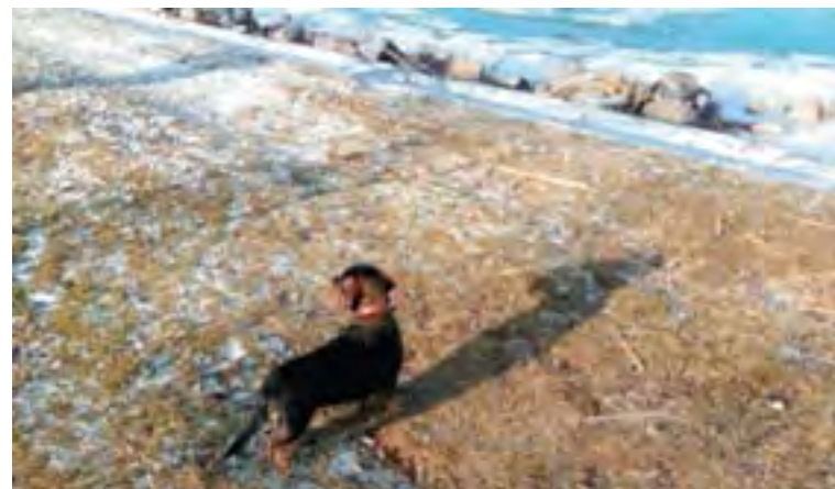
A befagyott Balaton partján – 2017. január.