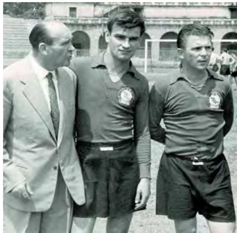
Guttman Béla Kocsissal és Puskással Milánóban, 1956 decemberében

De ne gondoljuk, hogy új pozíciójában egy csettintésére került Puskást a Real Madridhoz vinni. A nagytekintélyű madridi klubelnök első benyomása ugyanis kedvezőtlen volt a magyarok 10-eséről: az 1956. október 7-én játszott párizsi francia-magyar barátságos meccsen (1:2) látta először, és nem tett rá jó benyomást, leginkább az tűnt fel neki, hogy duci és sokat reklámál. (Sándor Károly viszont azonnal szerződtették volna, ő azonban visszautasította az ajánlatot) Östreicher azonban később mégis meggyőzte Bernabéut, hogy egy esélyt megérdemel az akkor már 31 éves Puskás, aki aztán 1958 májusában csatlakozott a csapathoz. A pályára lépéshez azonban