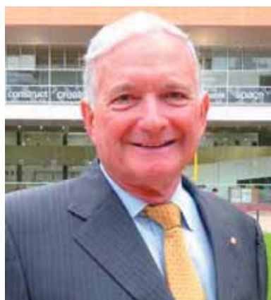
Hon. Nick Greiner