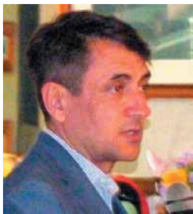
Potápi Árpád János