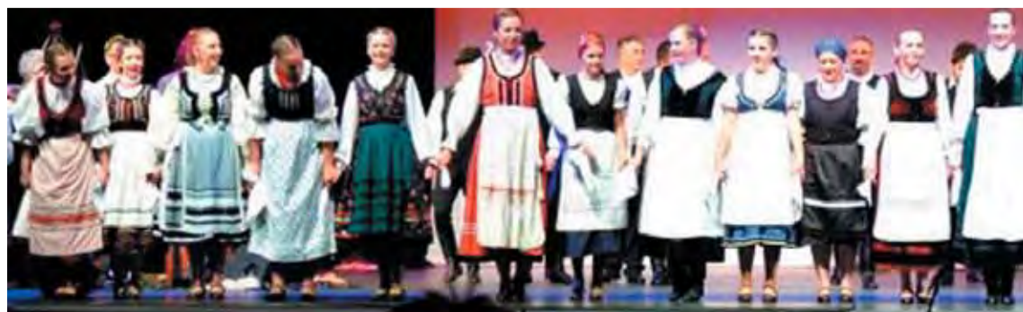
A Gálakoncert táncosai