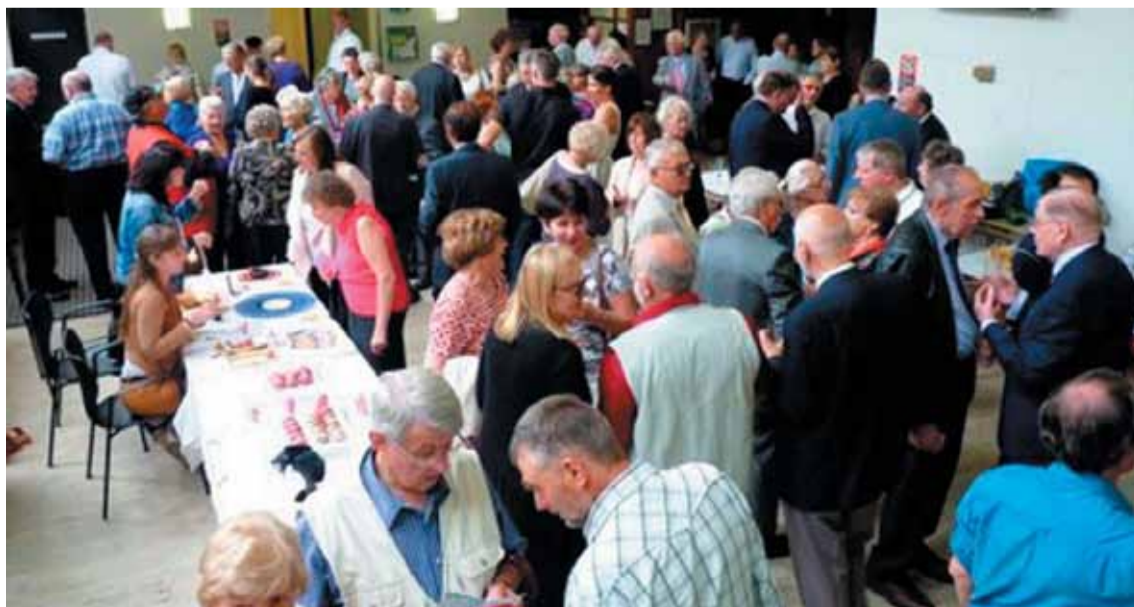
Állófogadás az első nap