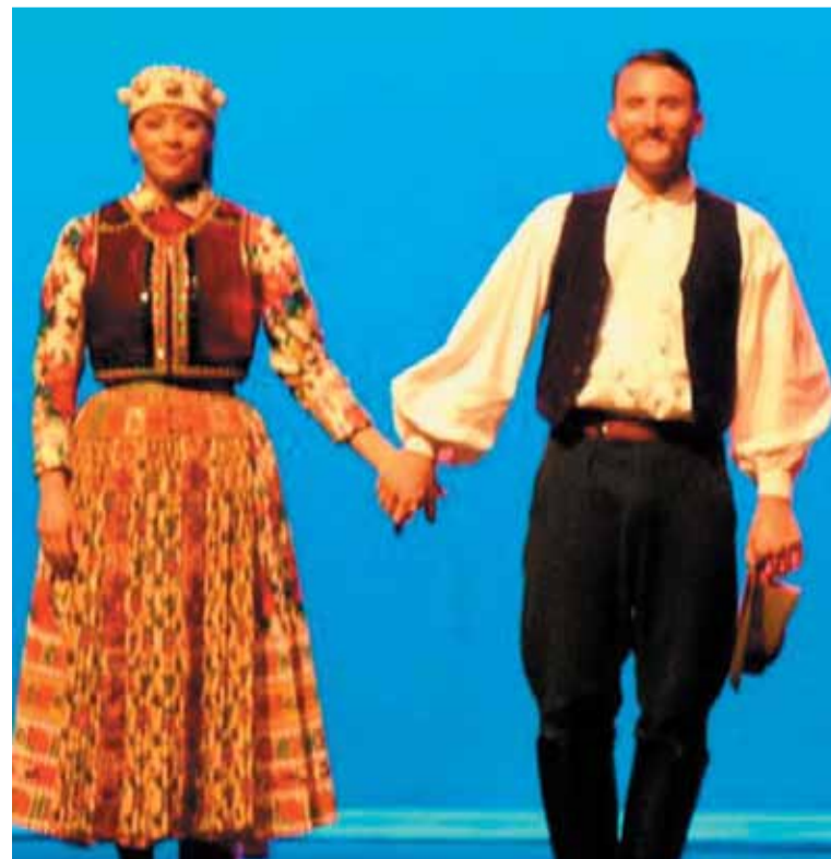
Magyarországról érkezett néptánc művészek