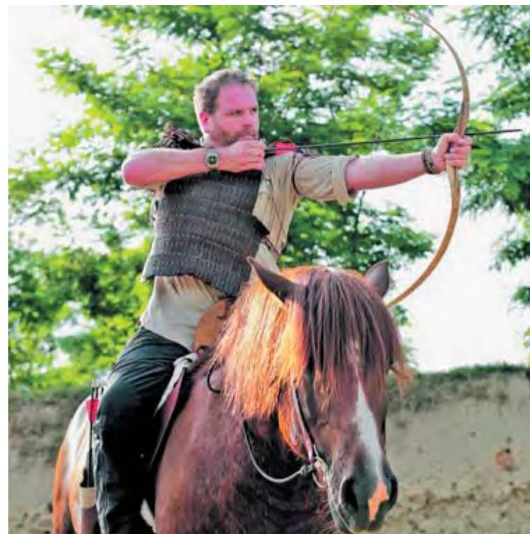
A műsorvezető a lovas íjászatot is kipróbálta a magyarországi forgatáson