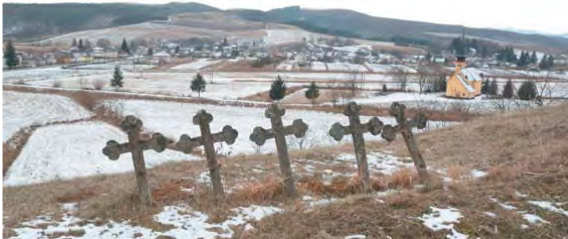
A két településrész között van a szépen felújított templom – a legöregebb falait az 1200-as években húzták fel – és a temető

rét tisztítják, onnan is kikerül néhány köbméter fa, amelyet szintén szétosztanak. Nem engedhetik meg, hogy bárki is megfagyjon. Odafigyelnek egymásra, ha valakinek nem füstöl a kéménye, benéznek, hogy csupán elaludt-e, vagy baj van.