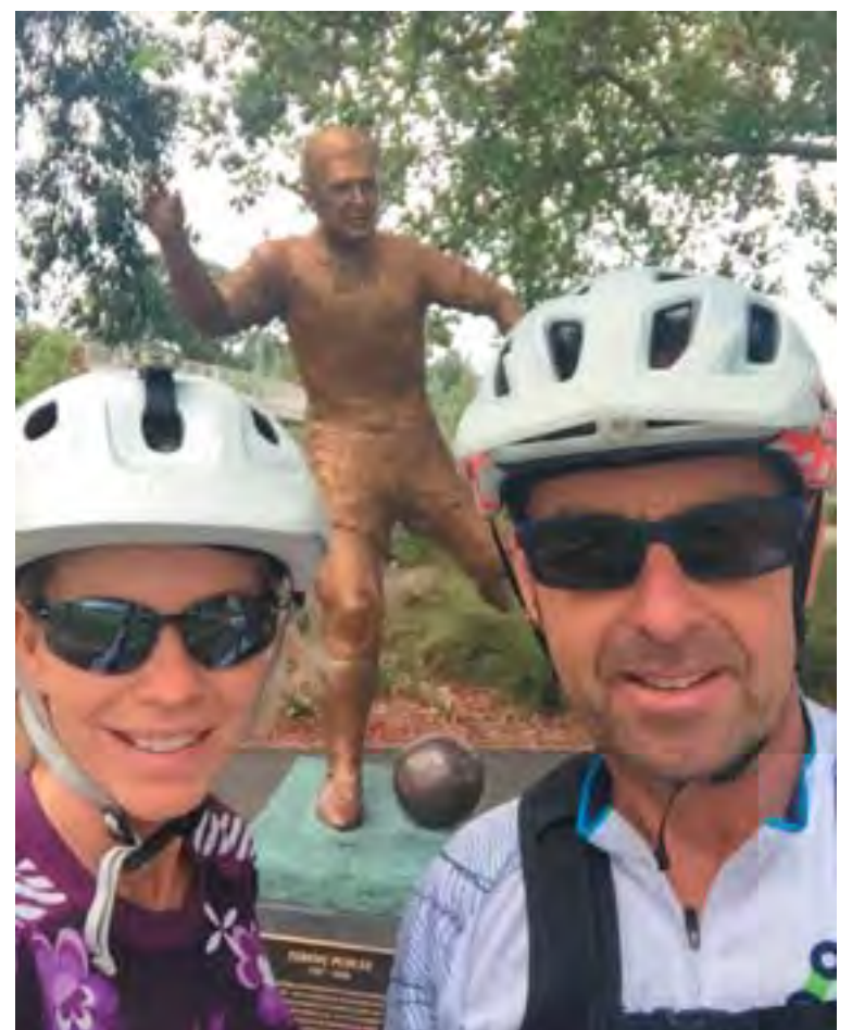
A szoboravatás másnapján, vasárnap délelőtt, a Yarra kanyarulatait követő bicikli és sétáló út szomszédságában lévő Puskás szobor már köszönthette első látogatóját. Köszönjük a beküldött fényképet.

Szepesi György első magyar sportújságíróként kapta meg a Gerevich-díjat, birtokosa az Orth György-díjnak, az Aranytollnak. Kodály Zoltán közművelődési díjat vehetett át a Pro Renovanda Cultura Hungariae Alapítvány kuratóriumától. 2004-ben a Prima Primissima-díj kitüntetését kapta, és ugyanebben az évben Magyar Sportújságírók Szövetsége Életműdíjjal jutalmazta. Birtokosa a NOB Olimpiai Érdemrend ezüst fokozatának, valamint a Magyar Köztársasági Érdemrend Középkeresztjének is. 1995-ben szűkebb pátriája, Budapest XIII. kerülete, majd 2005-ben a főváros is díszpolgárává avatta. 2012-ben az újonnan alapított Magyar Sportsajtó Halhatatlanja díjat és a Magyar Olimpiai Bizottság sajtóbizottságának Média-különdíját vehette át. 2016-ban a Magyar Labdarúgó Szövetség (MLSZ) Életműdíját kapta meg. A róla elnevezett Szepesi-díjat, amellyel a hazai újságírás és sportújságírás egyik meghatározó alakját díjazták, először 2015-ben adták át.