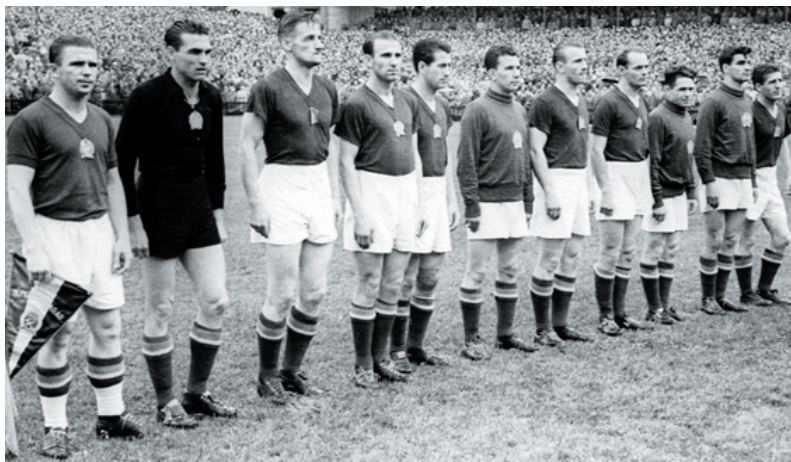
A magyar válogatottól mindenki aranyérmét várt a 1954-es világbajnokságon. A csapat balról jobbra: Puskás, Grosics, Loránt, Hidegkuti, Bozsik, Zakariás, Lantos, Buzánszky, Tóth, Kocsis, Czibor