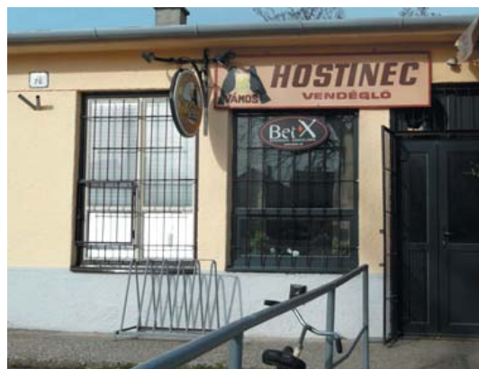
A felsővámosi kocsmá cégére