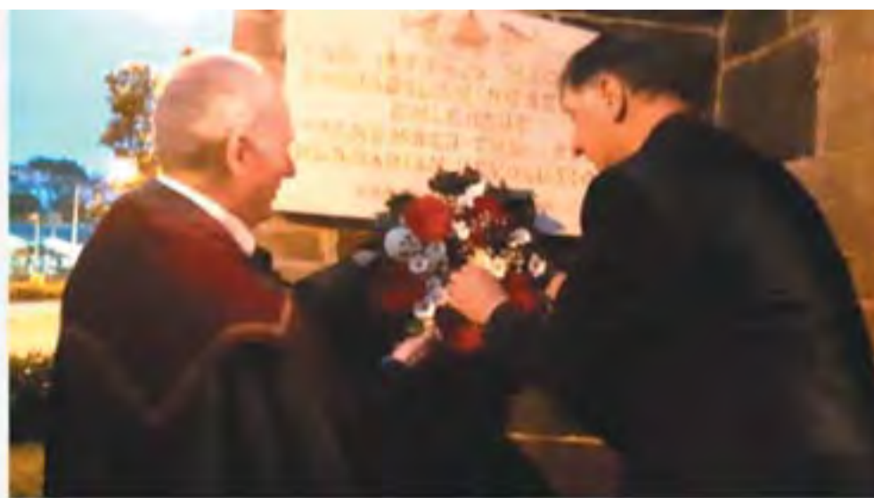
Koszorúzás a Templom falán lévő 56-os Forradalom Emléktáblájánál