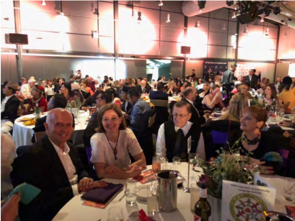
a 108-as számú asztalunk, alább a mellettünk lévő 115-ös asztal