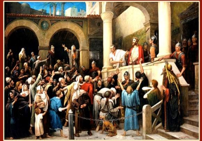
Ecce Homo 'Íme az ember', 1896