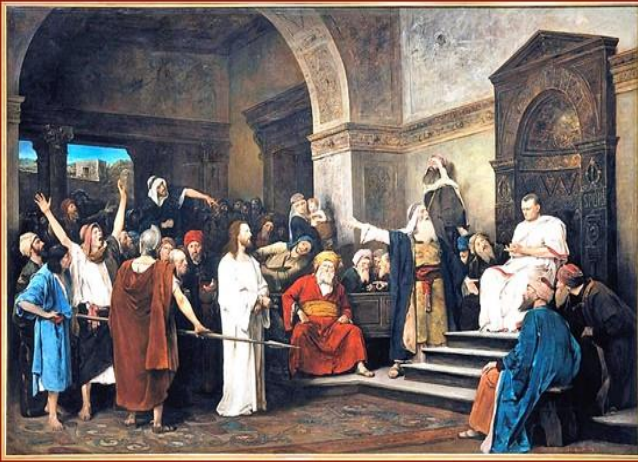
Kristus Pilátus előtt, 1881