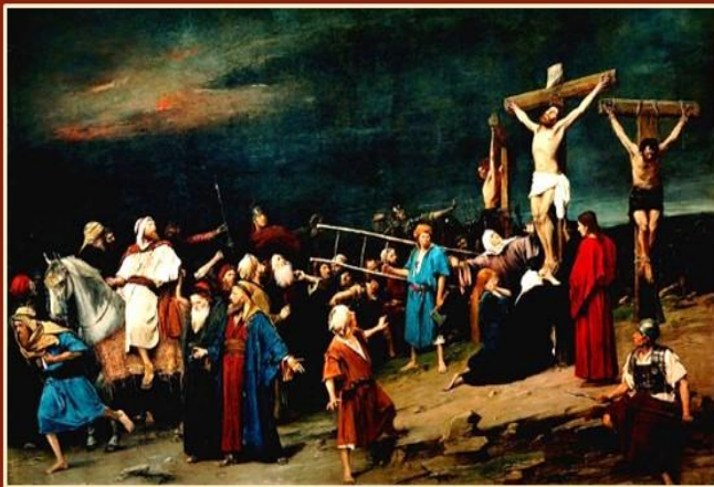
Golgota (Kávária), 1884